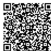
報名 QR code

◆本課程一律採網路報名，線上報名網址 https://pitdclist.fong-cai.com.tw/sub_index.asp?action=1&id=459